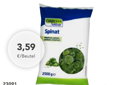
23091 Spinat gehackt 2,5 kg/Beutel