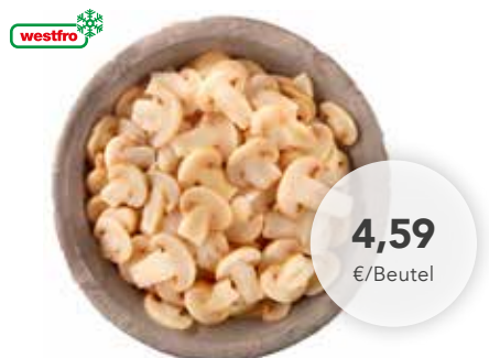
2344 Champignons geschnitten 2,5 kg/Beutel