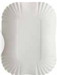
2120 Pappschale 41 13x18x3cm, weiß, 250 Stück