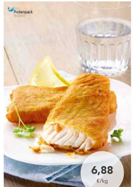
23851 MSC Backfisch Filets 80 x 75 g, 6 kg/Karton, aus Alaska-Seelachsfilet, praktisch grätenfrei, aus Blöcken geschnitten, in würzigem Backteig, vorgebraten 41,30 €/Karton