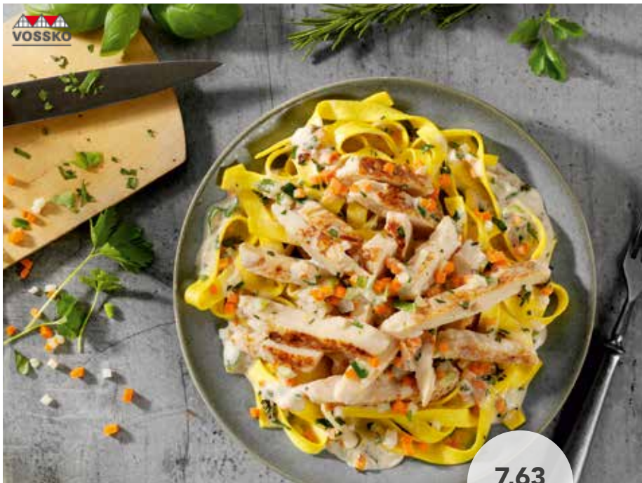
1159 Hähnchenbrust in Streifen, gebraten halal zartes Hähnchenbrustfilet, flüssig gewürzt, vollständig durchgegart, fertig gebraten, in Streifen geschnitten, 3 kg 22,89 €/Karton