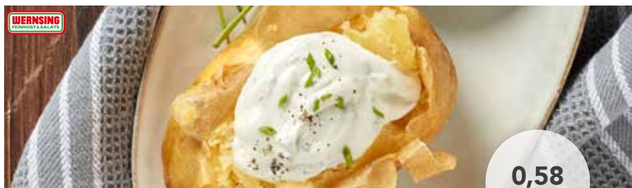
1022 Baked Potatoes 250 g/Stück, 12 x 2 Stück, vakuumiert, eine Beilage aus gesunden und reifen Speisekartoffeln, die Kartoffeln wurden schonend pasteurisiert, 6 kg 13,90 €/Karton