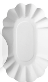
2121 Pappschale 51 9x14x3cm, weiß, weiß, 250 Stück