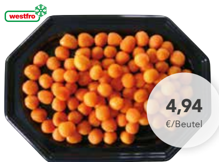
2342 Pariser Karotten 12/18er 2,5 kg/Beutel