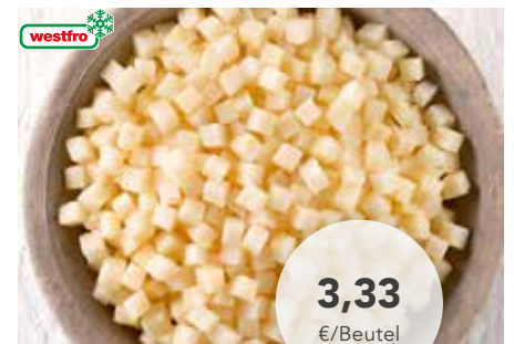
2325 Sellerie Würfel 2,5 kg/Beutel